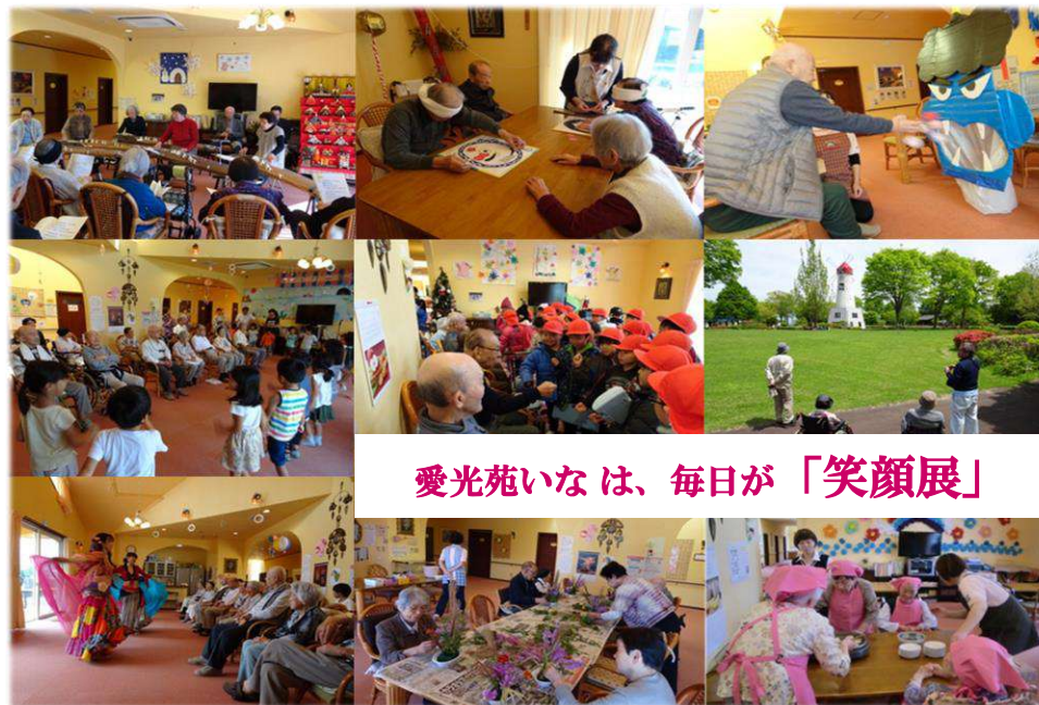
愛光苑いなは、毎日が「笑顔展」